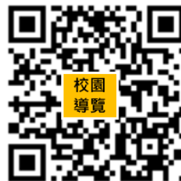
輔英科技大學校園導覽圖