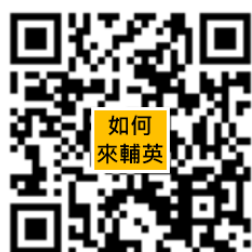
輔英科技大學交通資訊 (大眾運輸／自行開車)